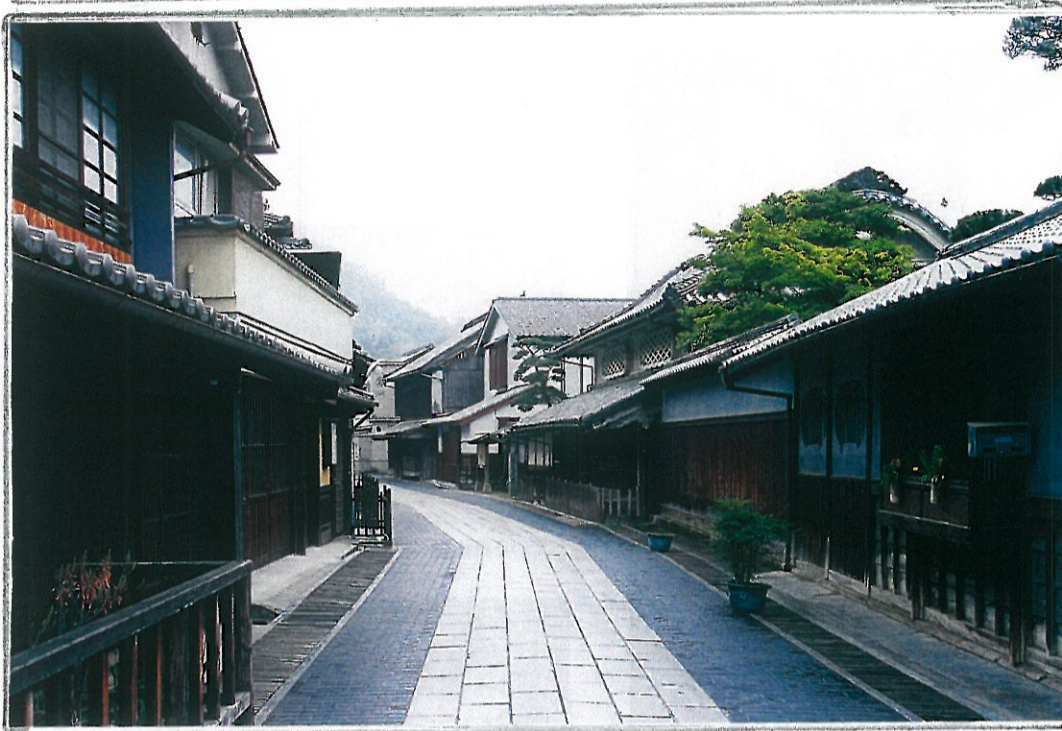
歩きたい町...竹原(広島)