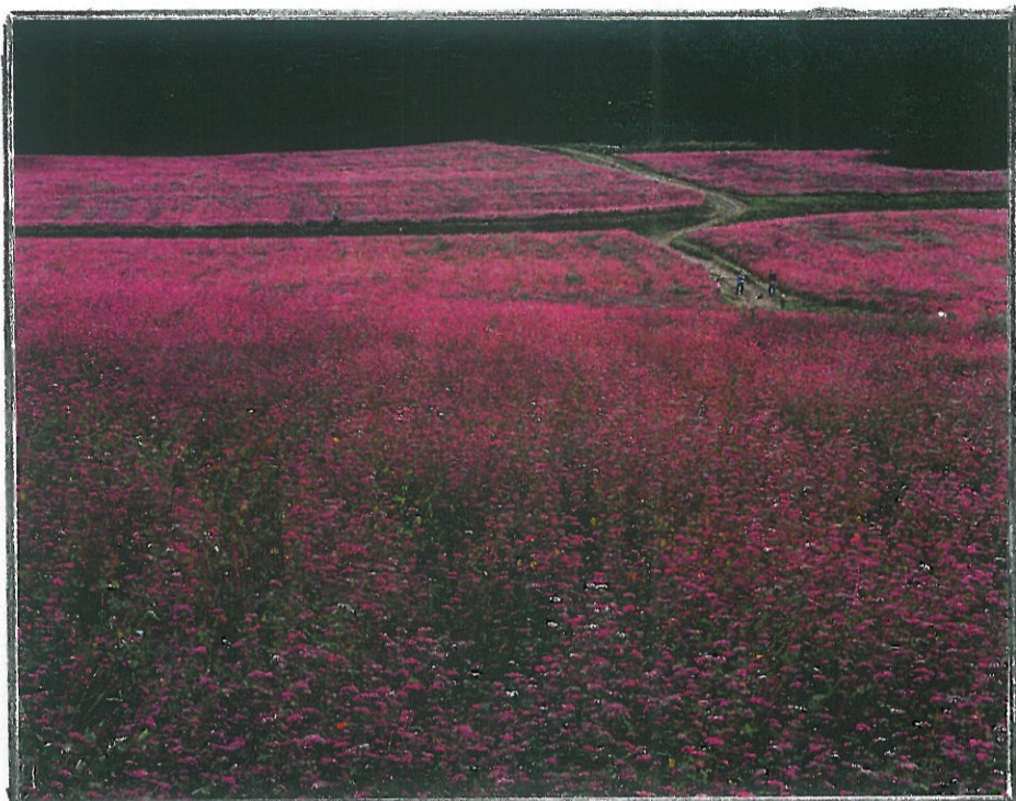
赤そばの里 長野県箕輪町