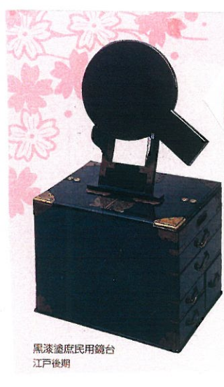
黒漆塗庶民用鏡台 江戸後期