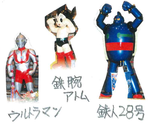
ウルトラマン 鉄腕アトム 鉄人28号

ユーモアくらぶ 先生がきいた 「18才と81才の 違いは何か」 生徒が答えた 「はい、おぼれるもの が違います。 18才は恋に 81才は風呂におぼ れます。」