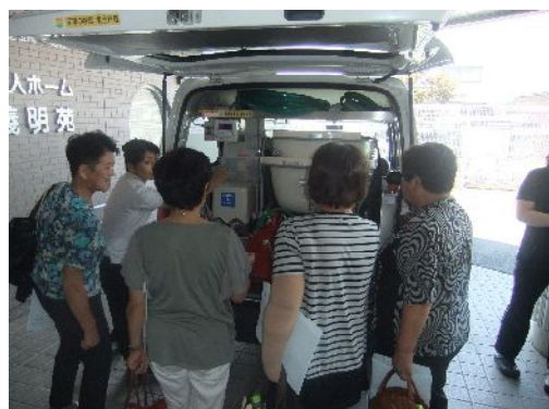
訪問入浴車の説明を聞く参加者

★次回開催は平成30年12月2日(日)を予定しています 内容:口腔ケアについて 場所:義明苑ふくとみ ～皆様の参加お待ちしております～