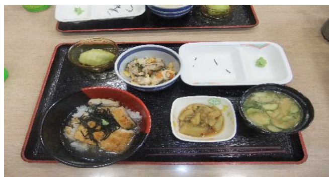
昼食の『ひつまぶし』と『冷や汁』おいしそう