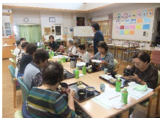
昼食を召し上がる参加者の皆様