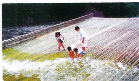
清流で鮎のつかみどり