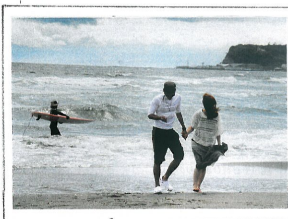
こんなときも... ...おれから40年