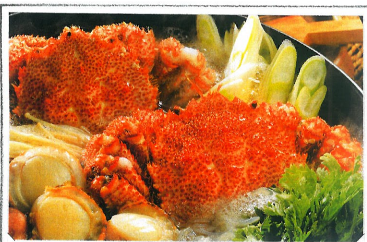
今日はコレで飲み封。毛ガニ鍋