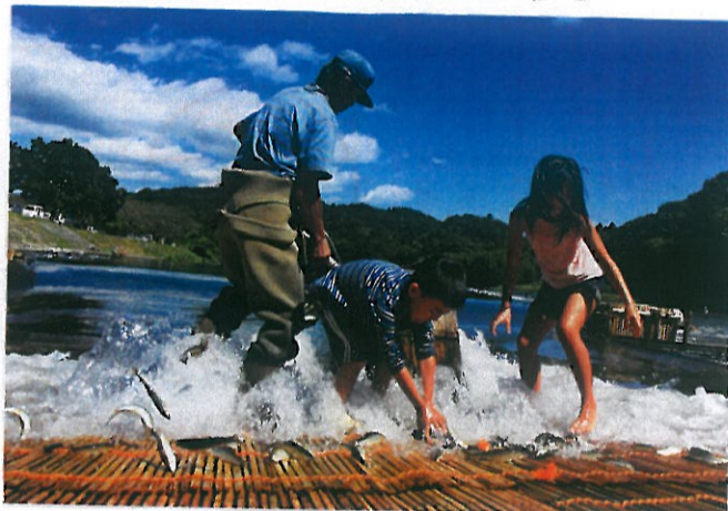
茂木町・観光やな