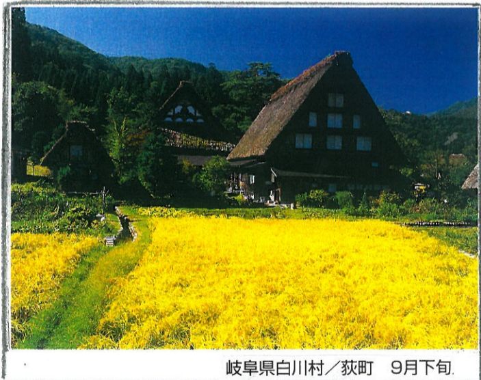
岐阜県白川村/荻町 9月下旬