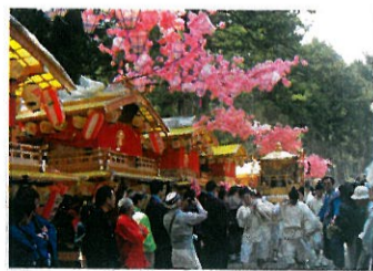
日光二荒山神社 弥生祭