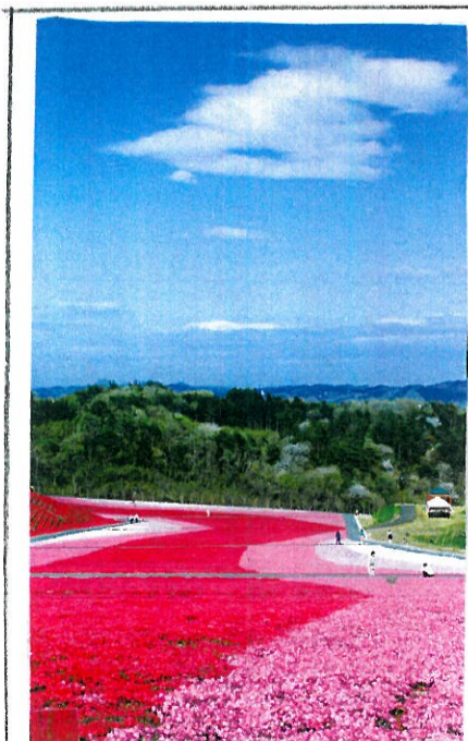
いちかまちほ 公園 市貝町芝ざくら公園