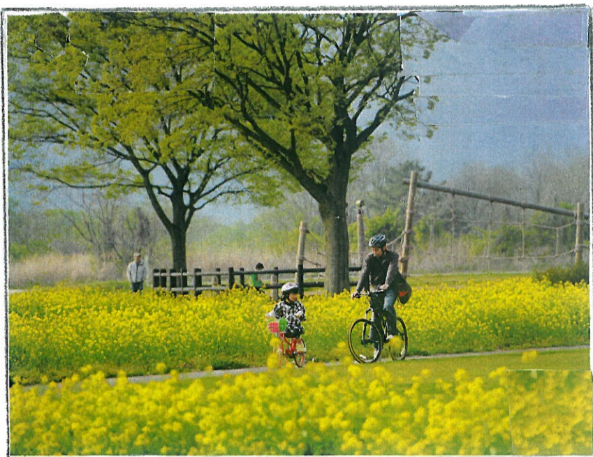
鬼怒グリーンパーク