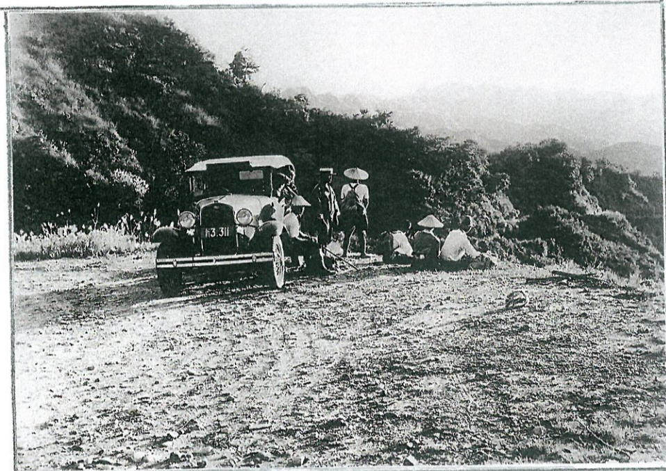
湯沢町歴史民俗資料館「雪国館」(撮影者不明・年代不明)