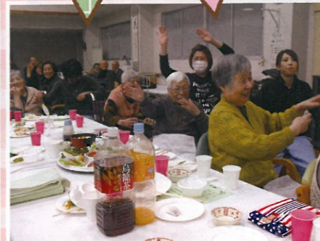
笑顔の花が咲きました。