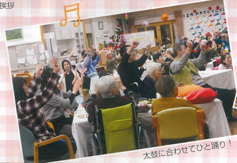
太鼓に合わせてひと踊り!