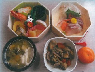
ケアハウス おせち料理