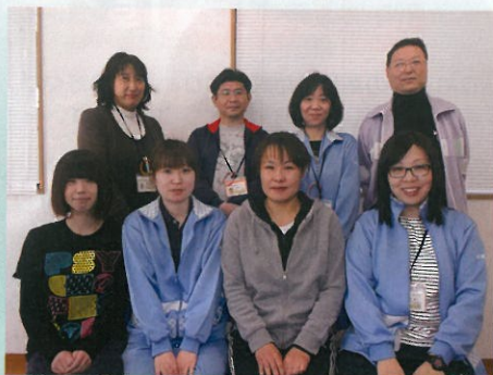
社会貢献・地域連携委員会メンバー

新しい年を迎え、入居者様・利用者様が元気に楽しく毎日を過ごしていただけのように新たな気持ちで支援させて頂きます。また、地域の方々との交流をさらに深めていけるよう活動してまいります。一昨年より義明苑本体では入居者の皆様が可能な限り自立できるよう日々、自立支援に取り組んでおります。日中は元気に、夜はぐっすり眠れる生活を取り戻し、寝たきりの生活から少しでも活動的な生活が送れるように職員は一生懸命学び、取り組みを行っています。笑顔の実現に向けて頑張りますので、どうぞ本年もよろしくお願致します。