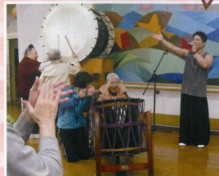
さあ一緒にたたきましょう!