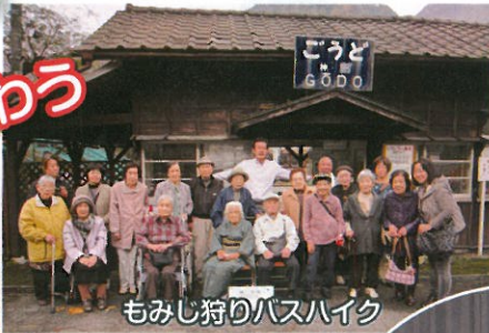
もみじ狩りバスハイク