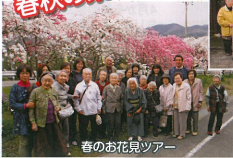
春のお花見ツアー