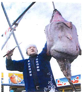
あんこうのつるし切