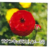
アネモネ、キンギョソウ、ナゲシコ、ランキュラス