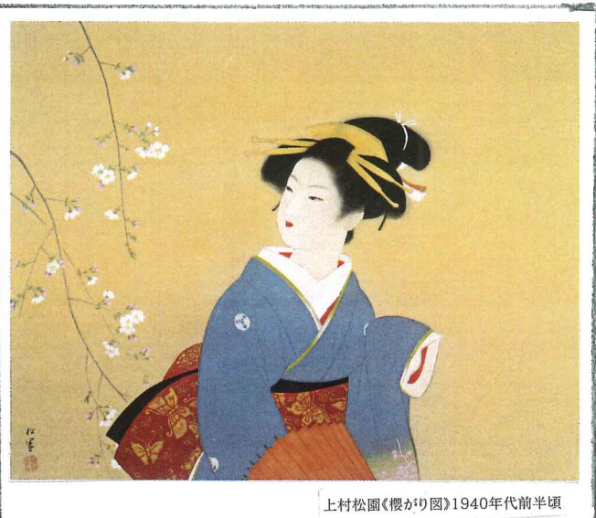
上村松園「櫻かり図」1940年代前半頃