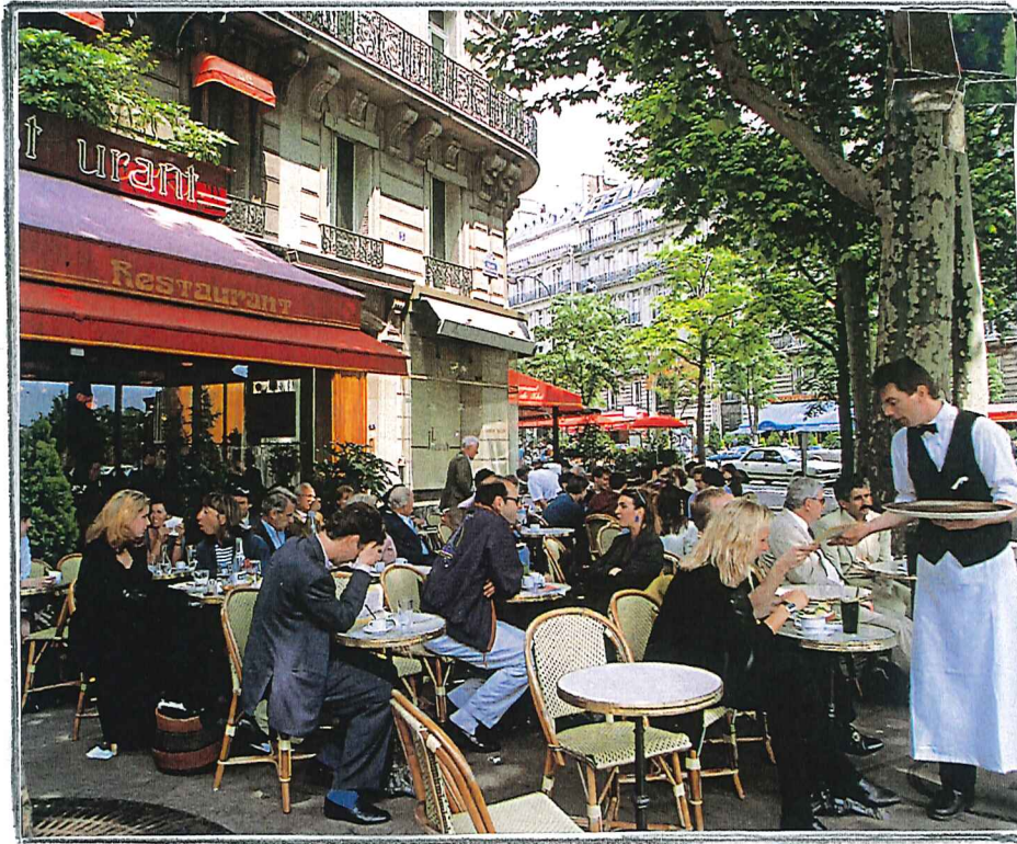
(こんな日常の風景に早くもどって... 街角のカフェ)