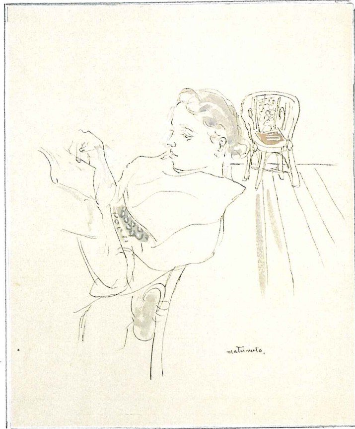
松本竣介《読書をする婦人》1941年頃