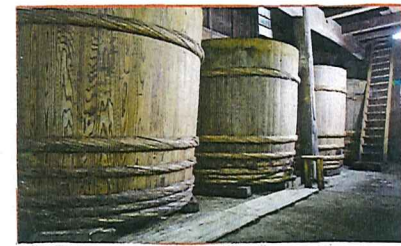
越後味噌醸造 (えちごみそじょうぞう)