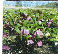
クリスマス・ローズ