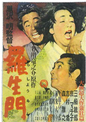
ベネチア映画祭金賞

「お母さん、わたし結婚するわ」 「えっ。」 「どんな相手」 「うむ...おとうさんによく似ているの」 「まあ、母は肩を落として言った。おまえも、同じ苦労するんだね」