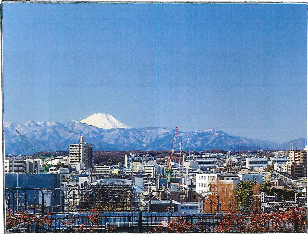
成城の富士見橋から撮影