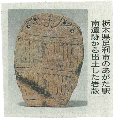
栃木県足利市のあがた駅 南遺跡から出土した岩版