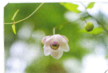
「森の妖精」レンゲショウマ