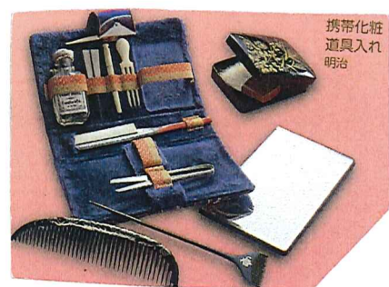
明治の頃の 化粧道具入れ