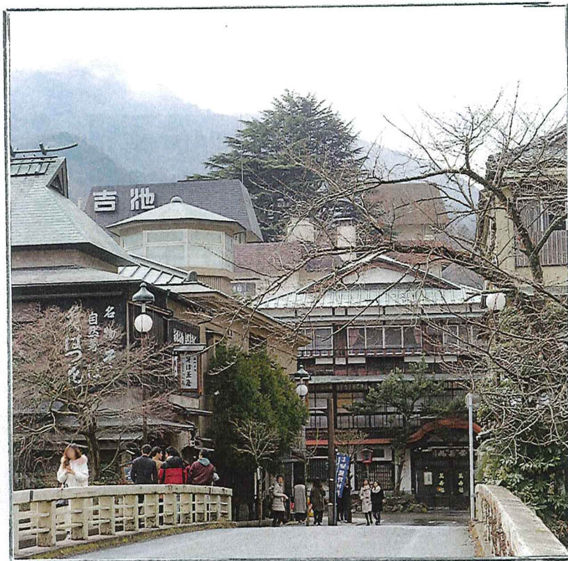
湯の街の風情にひたる(箱根)