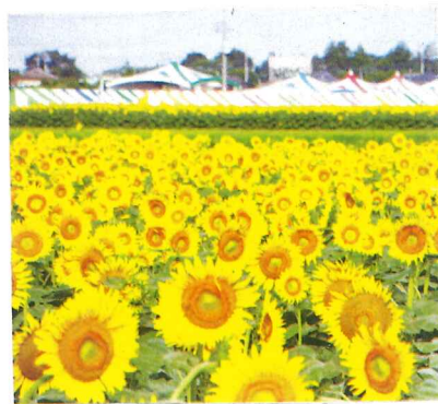
野木町 ひまわり フェスティバル