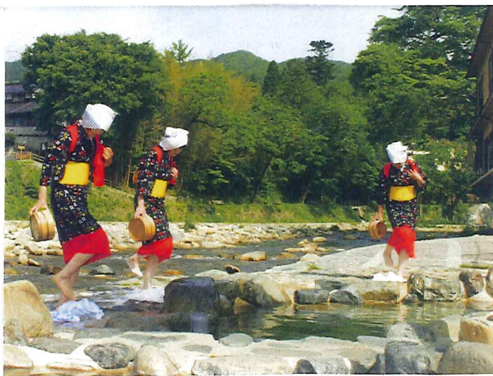
おくつ 奥津温泉 名物の 「足踏み洗濯」 (岡山県)