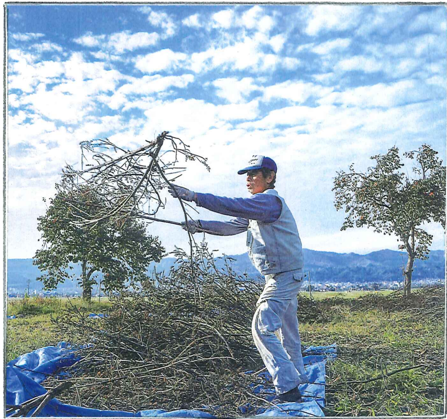
秋空の下、エゴマの実を落とす。