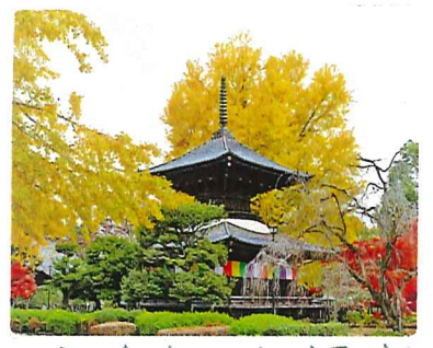
ばんな寺の大銀杏