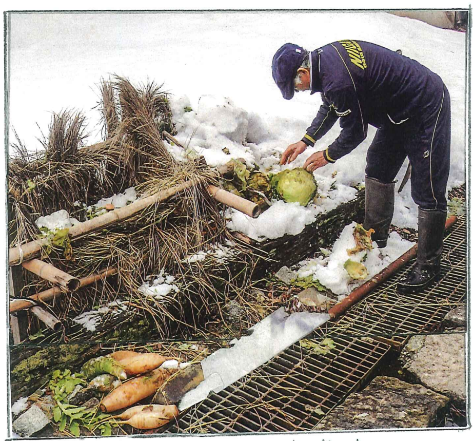
雪国の知恵... 野菜の保存法