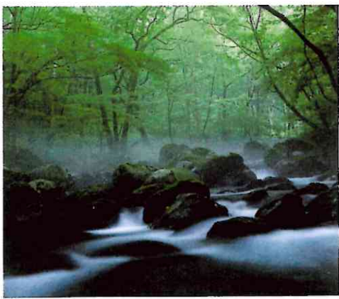
(塩谷町) 尚仁沢湧水