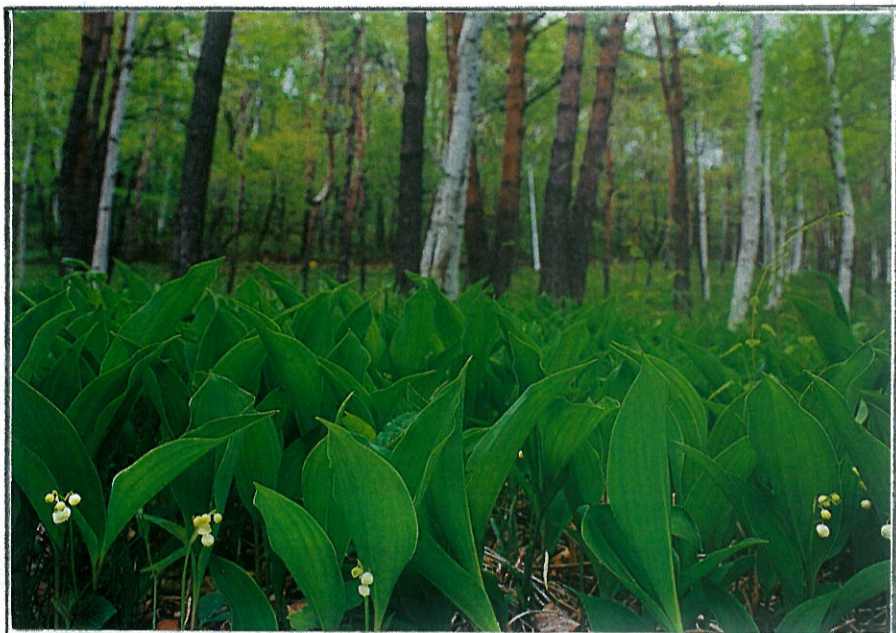
スズランは葉の陰から甘い香りを漂わせる。