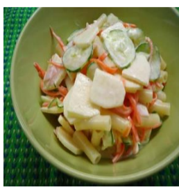
11/6 マカロニサラダ(リンゴ入)