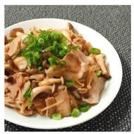
11/5 豚肉のポン酢炒め