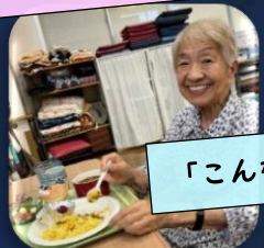
「こんなに豪華で食べられるかな？」