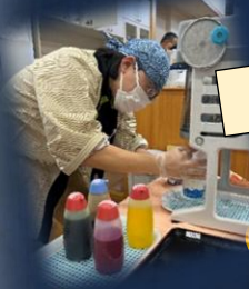
「お祭り楽しみにしてたよ！」