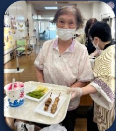
「かき氷美味しいよ！」