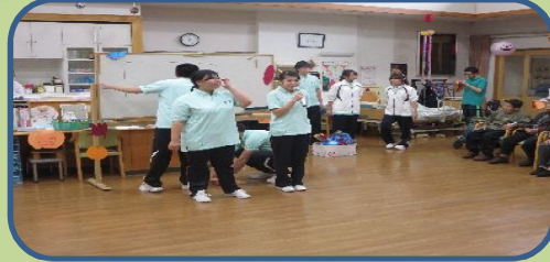
ペットボトルボーリング学生の皆と楽しく体操★