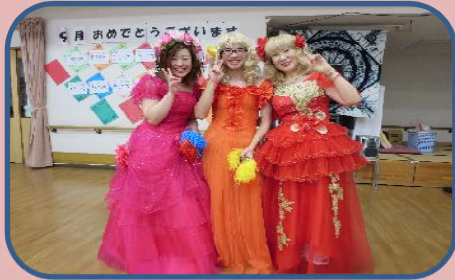
ニコニコ会様による踊り