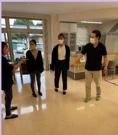
吉川相談員チーム

●35歳未満、入社して間もない職員をターゲットとして今回は4名の職員の方に参加して頂きました。